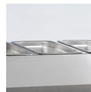
Lze vložit GN1/4 x 150 mm (nejsou součástí)