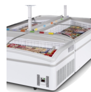
Instalace do ostrovů, police jako příslušenství