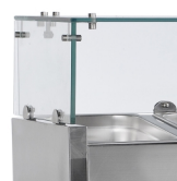
Prosklené víko na ochranu potravin