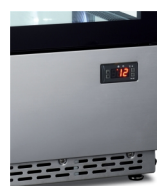
Digitální ukazatel teploty